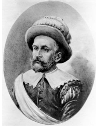
Pierre Minuit, né à Wesel, de parents calvinistes tournaisiens